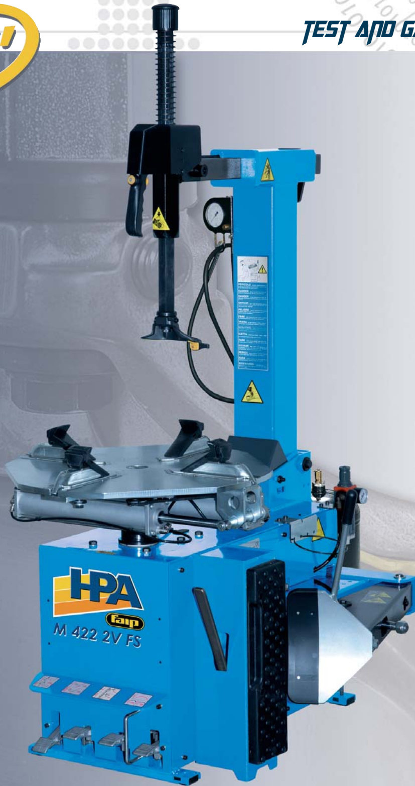
M 422 2V FS

Smontagomme automatico per cerchi fino a 22"